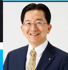
達増 拓也 岩手県知事