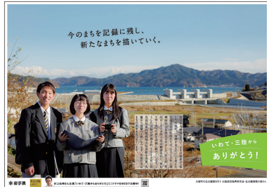
ポスター「大槌(県立大槌高校復興研究会)」編