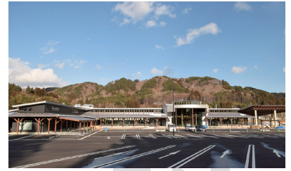
道の駅「いわて北三陸」

場所 岩手県久慈市夏井町鳥谷第7地割3-2 問い合わせ 久慈市総合政策部広域道の駅整備推進室 ☎0194-52-2115