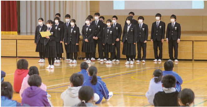
生徒が震災学習の成果を発表する様子

令和5年1月27日(金)、陸前高田市立高田第一中学校の3年生19人が、市内の高田小学校を訪問し、東日本大震災津波の教訓と防災の大切さを伝える活動を行いました。高田第一中の3年生は、総合的な学習の一環で、「伝承」「防災」「避難所」の3チームに分かれて東日本大震災津波について学んでいます。