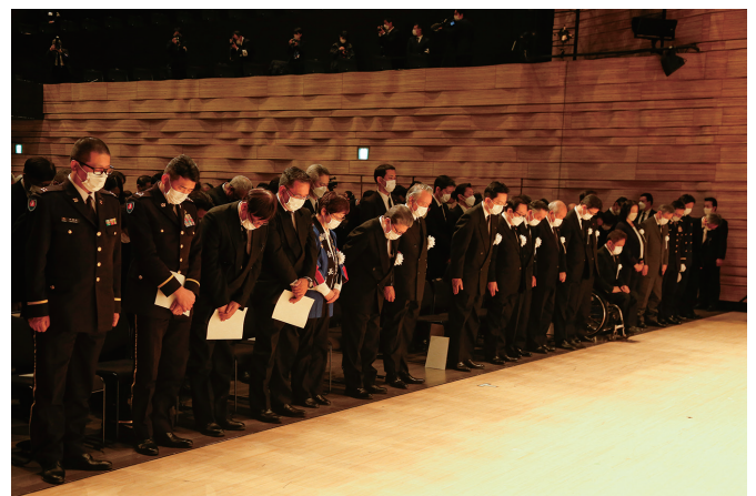
黙とうを捧げる参列者