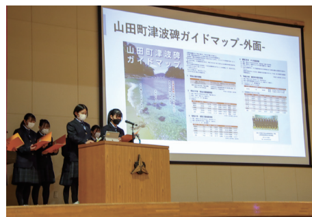
山田高校の生徒たちが「山田町津波碑ガイドマップ」を紹介する様子