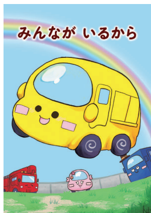
「いわての復興教育」絵本『みんながいるから』

県では40,000部を印刷し、幼稚園やこども園等の就学前施設のほか、図書館や公民館等の生涯学習施設、読書ボランティア団体、各学校等へ配付し、読み聞かせなどで活用していきます。