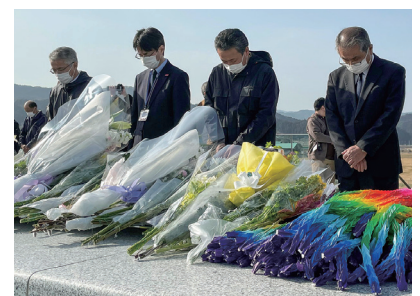
施設関係者による黙祷の様子