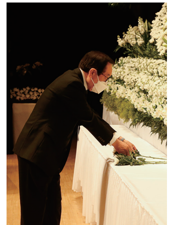
献花をする渡辺復興大臣